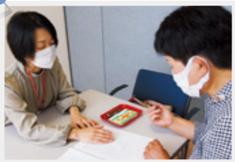
支店窓口で組合加入の申し込みを受け付けています

JA事業への積極的な参画のため「JAの組合員加入運動」に力を入れています。当JAの組合員のうち、女性は約3割。女性組織の活性化や女性参画を通じて地域農業の発展や暮らしやすい地域づくりに向け役割を担っていきます。