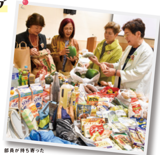
部員が持ち寄った食品や日用品