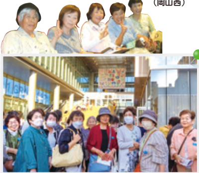
JAの合併3周年記念ツアーとして、岡山芸術創造劇場「ハレノワ」で劇団四季の「クレイジー・フォー・ユー」を鑑賞