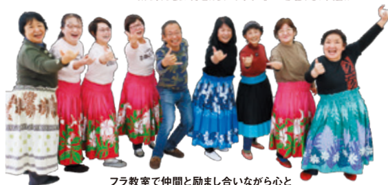
フラ教室で仲間と励まし合いながら心と体をほぐし、楽しく健康増進