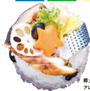
郷土料理のバラ寿司をアレンジした「晴寿司」