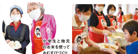
小学生と地元のお米を使っておむすびづくり