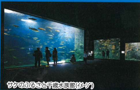
サケのふるさと千歳水族館(似-ジ)

観光マーク ◎入場観光 ○下車観光 ●車窓観光 △お買物 ※後日、改めて集合・解散地(および時刻)をお知らせいたします